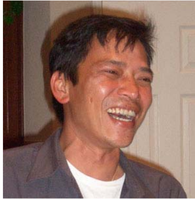
Hình 6: Cười