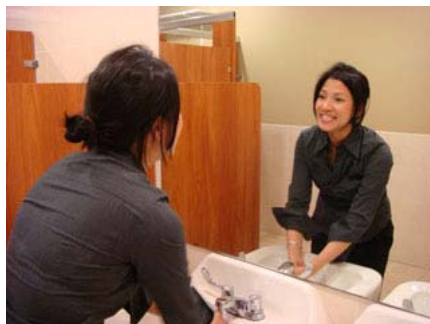
Hình 5: Mỉm cười

Suốt ngày chúng ta vào phòng vệ sinh 3-4 lần, ngoài ra trong ngày thỉnh thoảng ngồi hoặc đứng vươn vai sau mỗi một tiếng hoặc hai tiếng đồng hồ làm việc tạo điều kiện đã thông và khai thông kinh mạch để khí huyết lưu thông dễ dàng khắp cơ thể. Tạo được thói quen như thế sẽ không cảm thấy mệt mỏi sau một ngày làm việc.