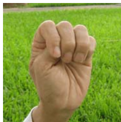
Hình 12: Tạo nắm tay