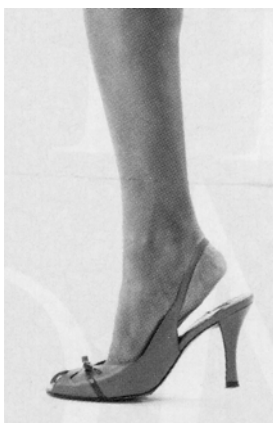
Hình 4: Nhón chân

Hít vào, nhón chân lên thở ra hạ gót mạnh xuống . Lập lại độ 10-15 lần.