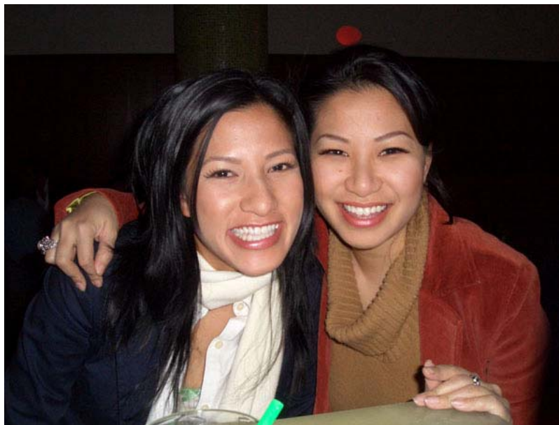
Hình 7: Cười